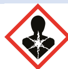
GHS08 Ernste Gesundheitsgefahr